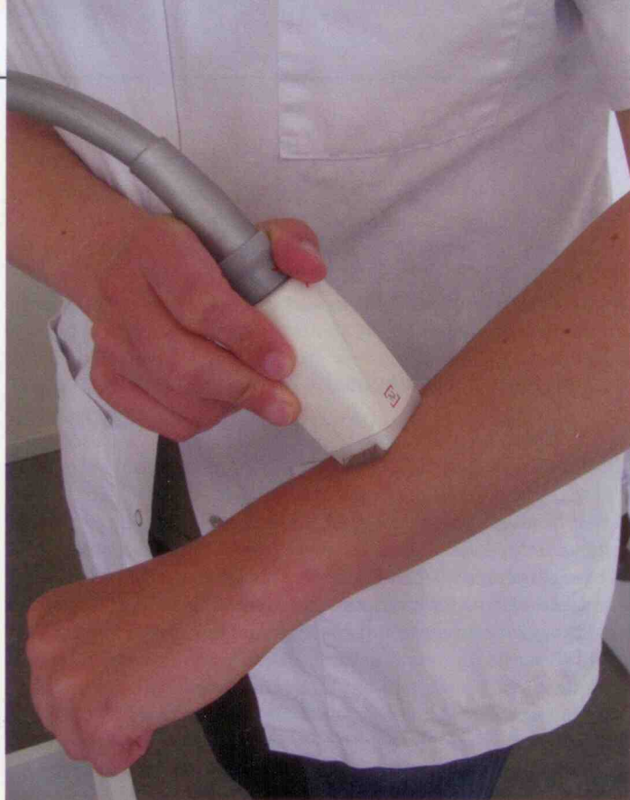
Het mondstuk van een LPG-apparaat zuigt op de huid vacuüm en wordt vervolgens over de huid heen en weer gerold.