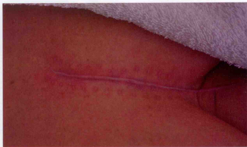
Litteken op het borstbeen na een hartoperatie.