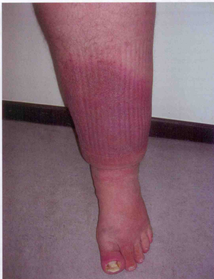
Lymfoedeem in het onderbeen, de voet en de tenen na multiple erysipelas. Na herhaaldelijk ingroeien van de nagel werd een partiële nagelextractie uitgevoerd. Daarna trad een infectie op met wondroos tot gevolg. Het onderbeen wordt tot en met de tenen behandeld door middel van lymfdrainage, compressietherapie en huidadvies. De nagel is uiteindelijk chirurgisch verwijderd.

Littekens kunnen nare klachten geven, zoals pijn, bewegingsbeperking, jeuk, verkleving, zwelling en roodheid. >>